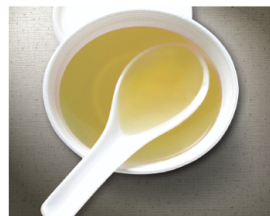
清粥湯、魚湯 肉湯、菜湯