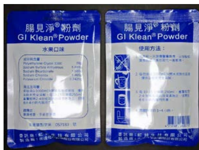
腸見淨粉劑 (GI Klean Powder)